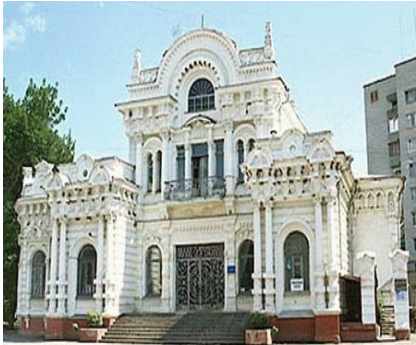
Музей Черкаської області, вул. Митрополита Іларіона, 10