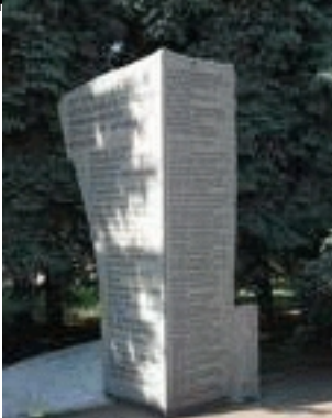
Пам'ятник на честь загиблих вояків Черкаської області, вул. Митрополита Іларіона, 10