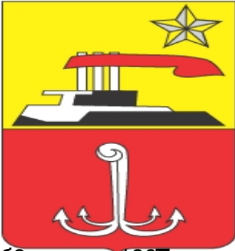
Зображення гербу Одеської області (1963-1991) з п'ятизіркою та прапором