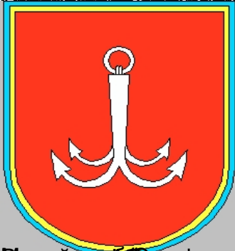
Зображення гербу Одеської області (2000-2015) з синьо-жовтим обрамленням