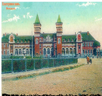
Дніпропетровський залізничний вокзал, 1864